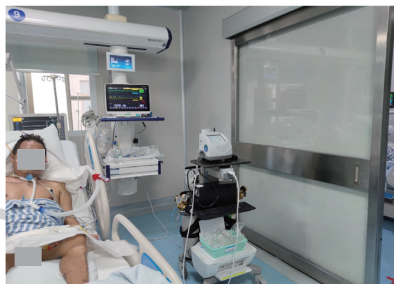
注:REE 为静息能量消耗

支持:急性期仅约 50% 接受肠内营养的危重患者可达到目标喂养量(104.6 kJ·kg -1 ·d -1 );待患者应激与代谢状态稳定后,能量供给量可适当增至 125.52~146.44 kJ·kg -1 ·d -1 。