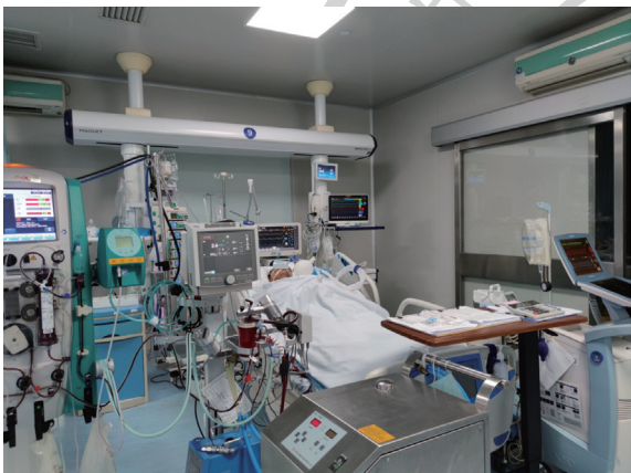
图 2 1 例接受 VA-ECMO+起搏器+IABP+CRRT+呼吸机治疗的 42 岁男性急性心肌梗死患者采用不同计算方法测得各时间点 REE 值变化

注：VA-ECMO 为静脉-动脉体外膜肺氧合，IABP 为主动脉内球囊反搏，CRRT 为连续性肾脏替代治疗